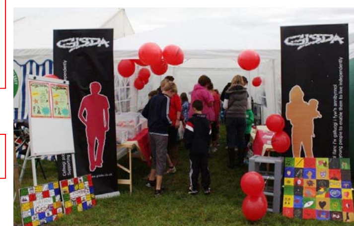
Pabell GISDA yn Sioe Môn Mona, Awst 2010