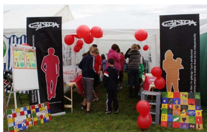
Pabell GISDA yn Sioe Môn Mona, Awst 2010